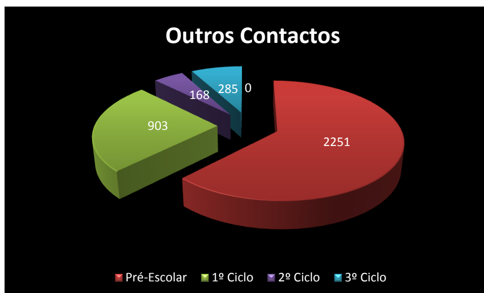
Gráfico 2 – Outros Contactos.

Da análise do gráfico 2 podemos observar que, para além dos contactos expostos no ponto anterior, foram realizados outros contactos, ocorridos entre os Encarregados de Educação (EE) e as Educadoras, Professores Titulares ou Diretores de Turma, sendo a sua grande maioria